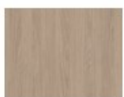
Chêne d'Orléans taupe