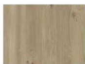
Chêne des massifs