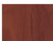
Bois de Pécan