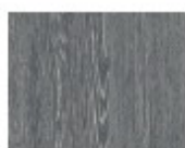
Wengé poivré cérusé