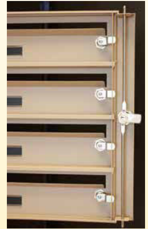
Tringlerie 3 points / Ouverture porte collective et portes individuelles